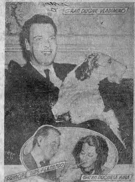
He aquí al gran duque Vladimiro Cirilovich, supuesto candidato al trono de Rusia de ser destruido el régimen comunista por los ejércitos de Hitler, retratado en su casa de Breaña con su can favorito. En el círculo, el príncipe Luis Fernando de Hohenzollern y su esposa la gran duquesa Kira, hermana de Vladimiro.

Acaso por la imaginación del venerable anciano pasaban en tropel los días febriles, emocionantes, extenuadores de la primera guerra mundial. Y aquellos otros de finales del siglo pasado en que su juventud de autócrata se rebeló contra la sabiduría del viejo Canciller de Hierro que le había proporcionado un imperio. Si hubiera escuchado a Bismarck, si hubiera buscado una alianza con Rusia, la batalla del Marne no hubiera ocurrido o hubiese terminado de distinto modo y la guerra también. La historia nos di-